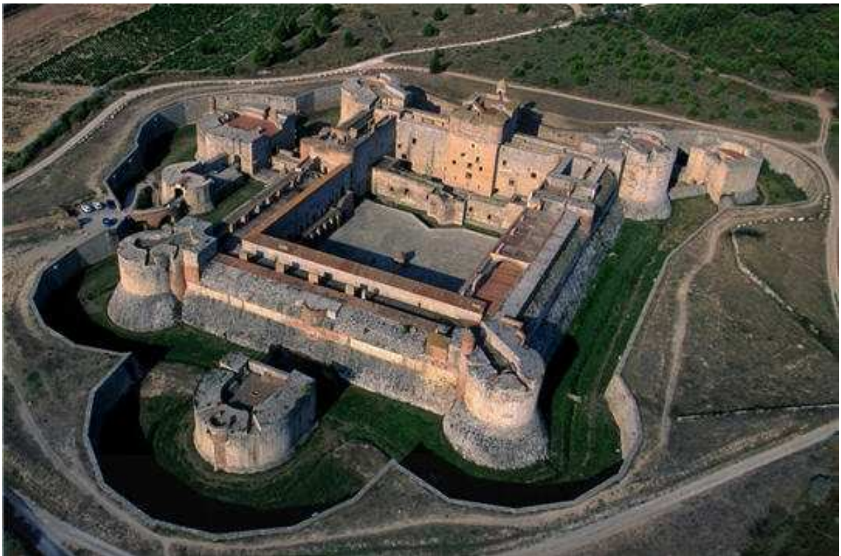
Le fort de Salses (1497), Pyrénées Orientales. C'est le prototype des forts de l'époque moderne.

Le château fort féodal est condamné en tant que résidence pour devenir un fort doté d'une garnison importante capable de résister plusieurs mois. Ces places illustrent et concrétisent la puissance retrouvée du pouvoir royal qui défend ainsi ses frontières et matérialisent le passage à la période moderne.