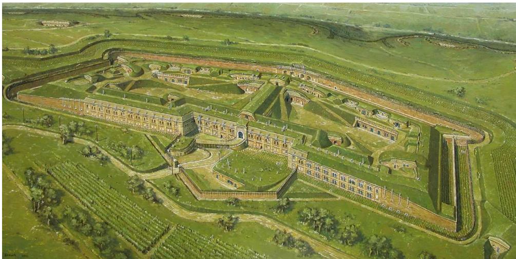
Fort Großherzog von Baden, Straßburg, Bild von A. Brauch

Diese Festungen sind wegen ihrer Technik und Organisation die letzten « traditionellen » Befestigungsanlagen. Beim Bau wurden entweder Quadersteine oder Backsteine benutzt und schließlich alles mit Erde überdeckt.