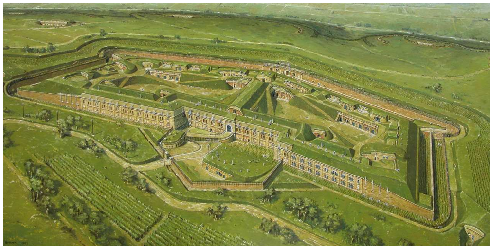
Fort Großherzog von Baden, Strasbourg, tableau A. Brauch

Construits en pierre de taille, en briques et recouverts de massifs de terre, ces forts sont par leurs matériaux les dernières fortifications « traditionnelles ».